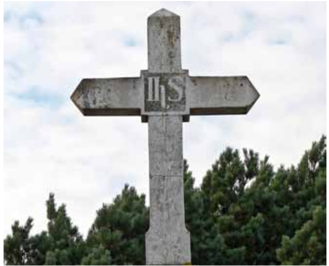
Katholischer Friedhof Ginderich