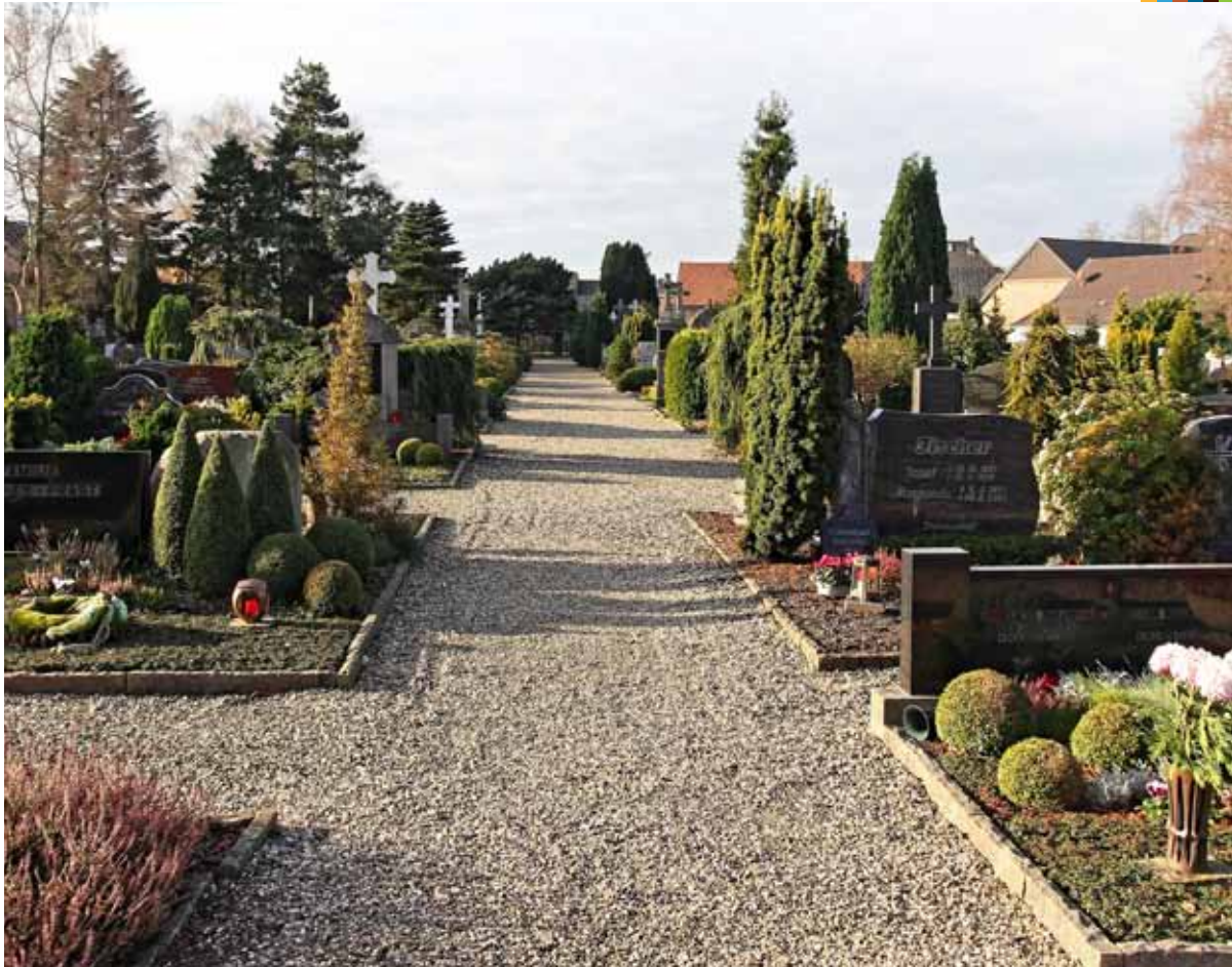
Katholischer Friedhof Ginderich