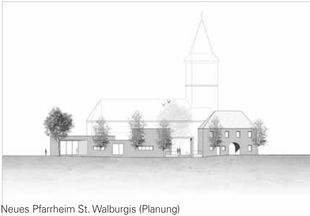
Neues Pfarrheim St. Walburgis (Planung)

Die Planungen für den Neubau des Pfarrheims in St. Walburgis konkretisieren sich. Der Bauausschuss des Kirchenvorstandes ist in enger Abstimmung mit dem Bistum Münster und dem Architekten Holger Hölsken mit den Vorbereitungen des Baubeginns beschäftigt. Nach mehreren Beratungsgesprächen mit dem Bistum Münster sind die Pläne soweit fertiggestellt, dass bereits zeit-