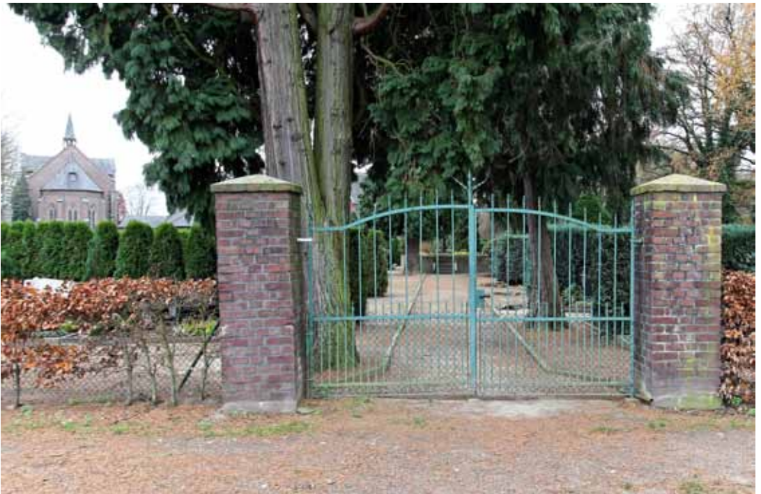
Katholischer Friedhof Bönninghardt