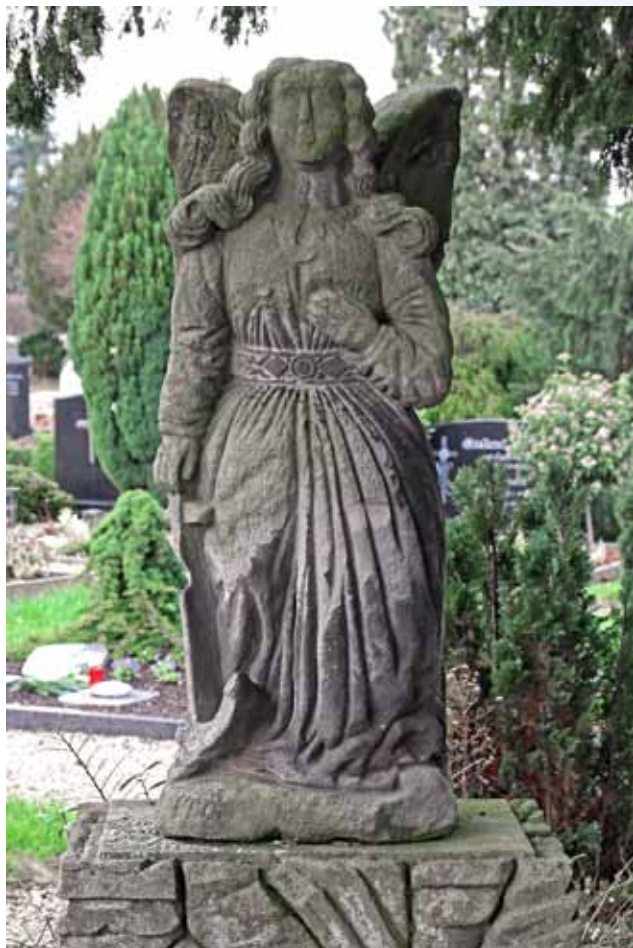
Katholischer Friedhof Buderich