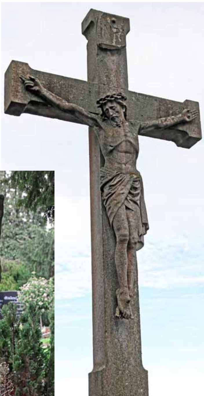
Katholischer Friedhof Buderich