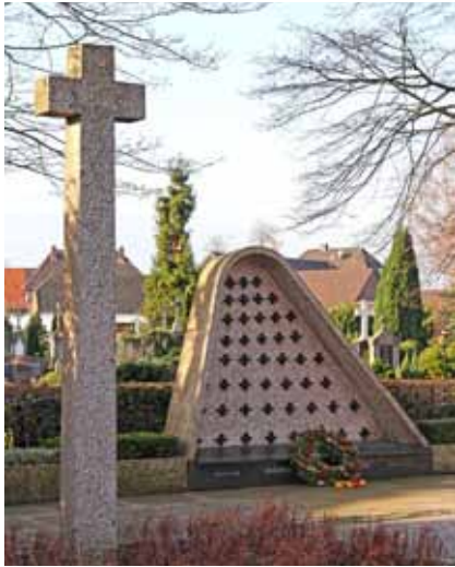
Katholischer Friedhof Ginderich