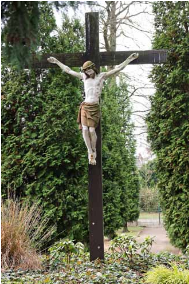
Katholischer Friedhof Bönninghardt