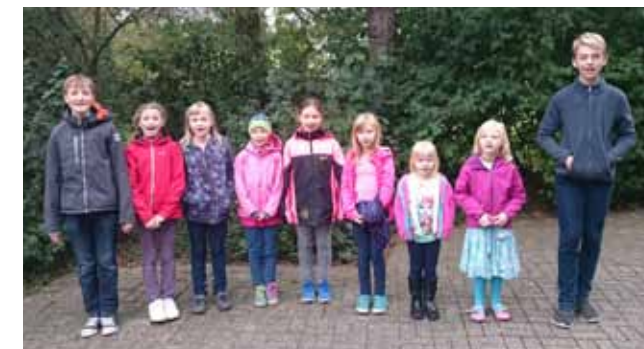
Kinderchor St. Ulrich

Der Kinderchor St. Ulrich besteht in seiner derzeitigen Form seit 2013. Momentan kommen acht Kinder im Alter von 7 bis 12 Jahren zu den Proben, die an jedem Donnerstag von 16 bis 17 Uhr im Pfarrheim St. Ulrich stattfinden. In dieser Zeit üben wir zusammen die Lieder, die wir in Familiengottesdiensten, zu Weihnachten, zur Erstkommunion oder zum Erntedankfest im Schützenfestzelt in Menzelen singen. Wir haben auch schon bei einer Hochzeit und bei einer Taufe gesungen, und im letzten Sommer haben wir zusammen mit dem Kirchenchor St. Ulrich ein Sommerkonzert am Marienstift veranstaltet. Zur Zeit üben wir Lieder für den Gottesdienst zur Eröffnung der diesjährigen Erstkommunionaktion und für den Familiengottesdienst an Heiligabend.