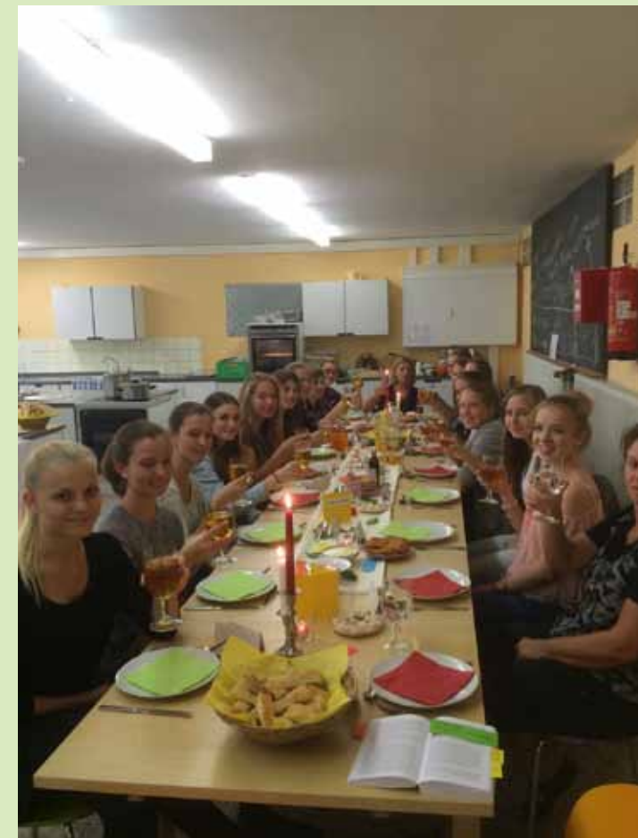
Firmanden vor einem gemeinsamen Essen