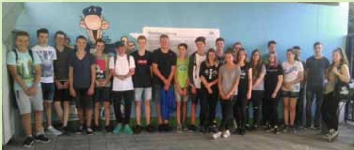
Jugendliche auf Schalke