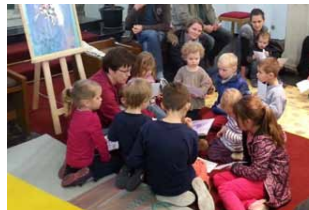
Kirche Kunterbunt in St. Peter

Kinder sind willkommen! Wie gut, dass es in unserer großen Gemeinde viele Gelegenheiten gibt, Gottesdienste zu besuchen, die ganz speziell auf (kleine) Kinder zugeschnitten und so gestaltet sind, dass die Kinder diesen mit Freude