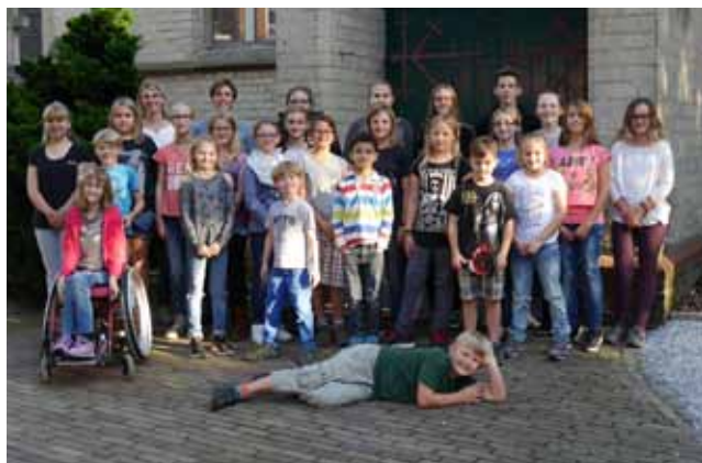
Kinder- und Jugendchor St. Walburgis