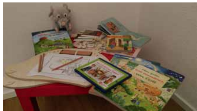
Dieses Angebot erwartet die Kinder in allen unseren Kirchen

All diese Sachen sind gedacht für Kinder bis zur dritten Klasse. (Denn wenn sich die Kinder auf die Erstkommunion vorbereiten, bietet es sich an, den Ablauf des Gottesdienstes bewusster