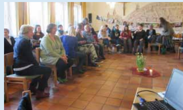
Die pädagogischen Mitarbeiterinnen bei den Verbundtagen

In regelmäßigen Leitungskonferenzen wurden erste gemeinsame Strukturen angelegt, wie z.B. die Aufnahmekriterien, die nun in allen acht Kindertagesstätten gleich sind.